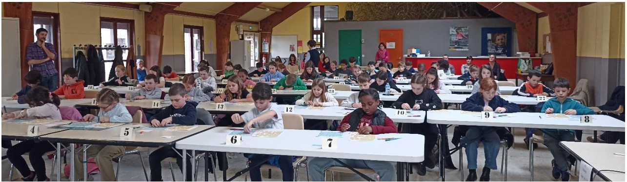
Concentration et réflexion avant d'inscrire sa solution sur le bulletin jeu