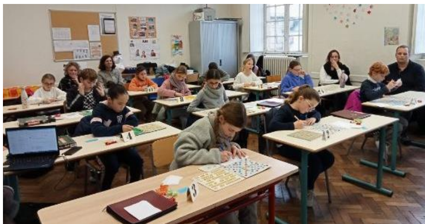
Des enfants appliqués pour la partie officielle

Les enfants terminant aux deux premières places de leur niveau sont récompensés :