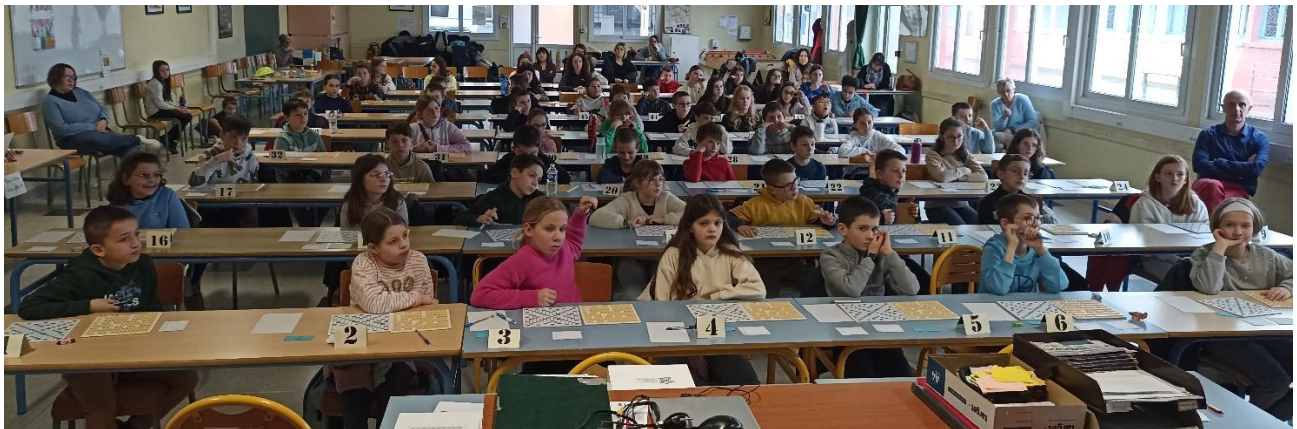
Des enfants prêts à jongler avec les caramels pour trouver la meilleure solution