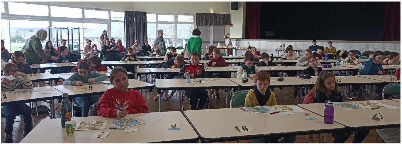
Puis c'est la partie officielle ; on essaie et réessaie avant d'inscrire sa solution sur le bulletin jeu