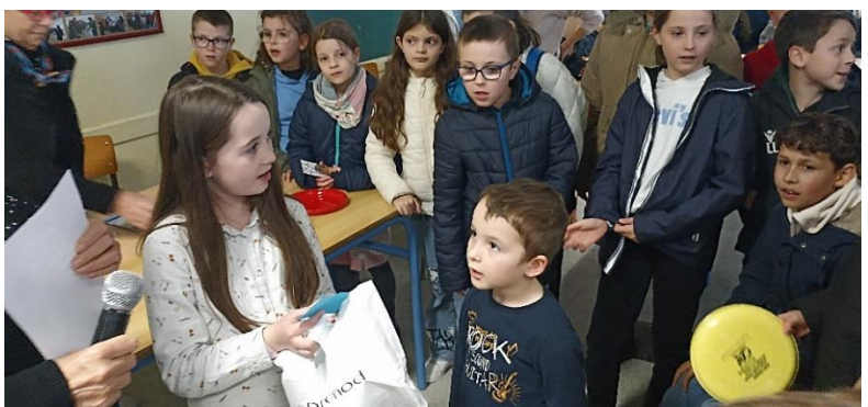
Goûter pour petits et grands... puis tirage de la tombola