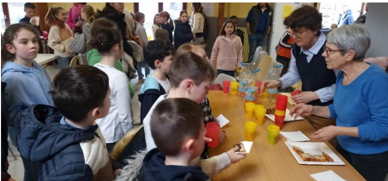
Goûter pour tout le monde...