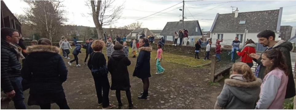
Moment de défilé apprécié