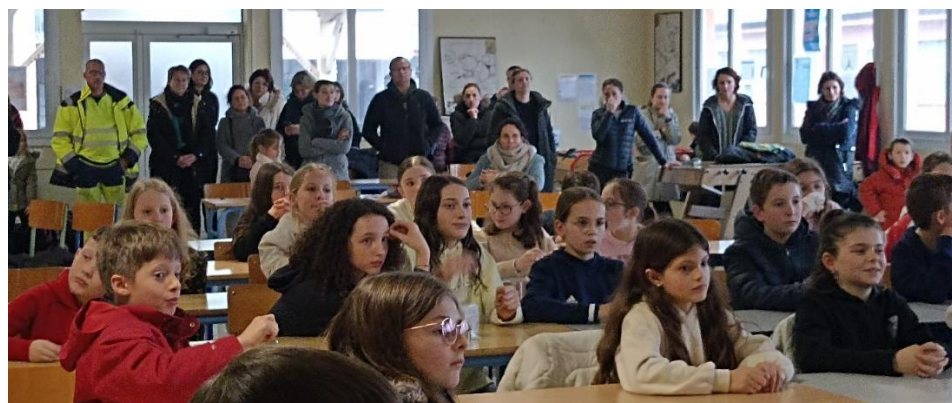
A l'écoute des résultats