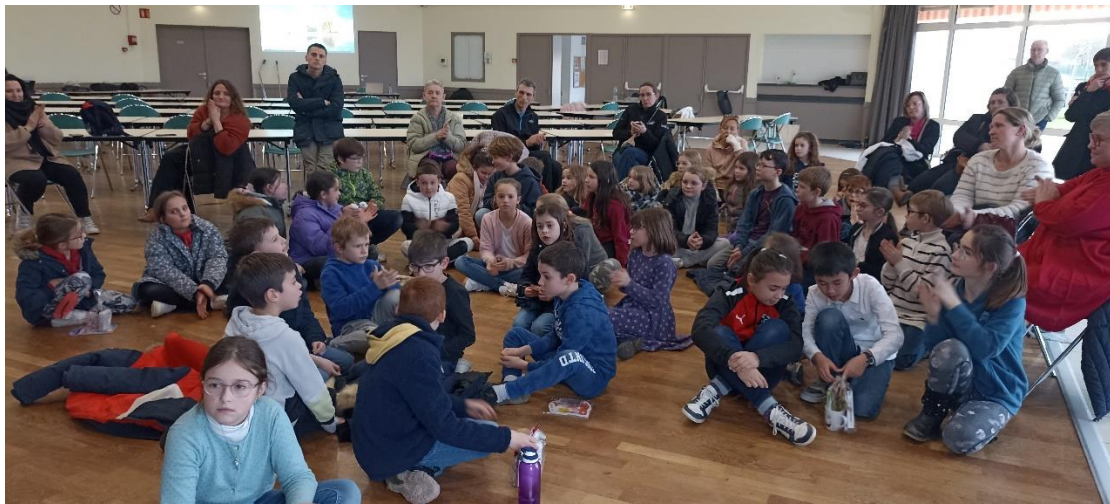
Regroupement pour le tirage de la tombola puis l'annonce des résultats