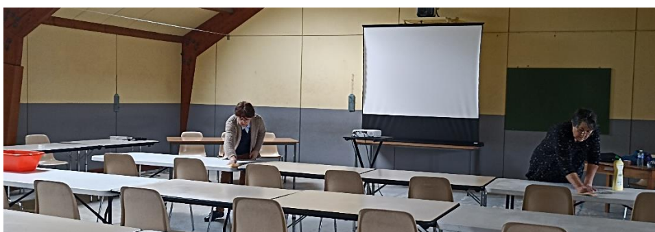
Le scrabble mène à tout...