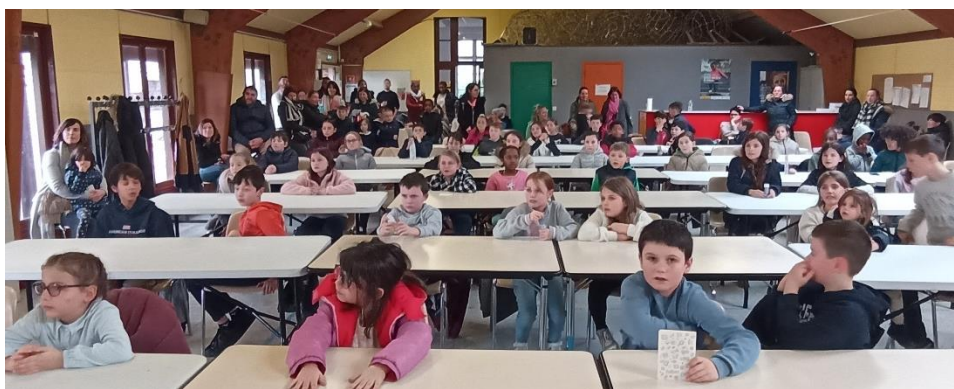
Tous à l'écoute des résultats