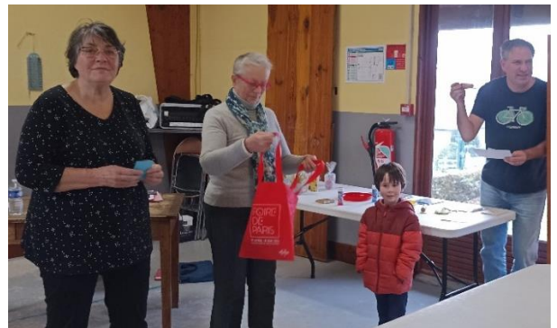
avant le tirage de la tombola