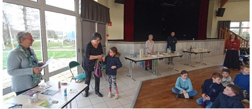
Goûter pour petits et grands... et tirage de la tombola