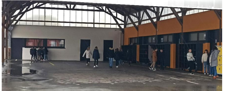
Moment de dévouement apprécié, à l'abri de la pluie !